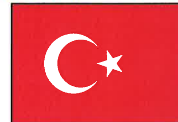
I 1453 erobret sultan Mehmet II Konstantinopel fra det bysantiske riket og gjorde Istanbul til hovedstad. Dagens Tyrkia ble etablert i 1923.