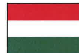
Ungarn ble innlemmet i riket i 1526 og forble en del av dette frem til slutten av 1600-talet.