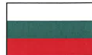
Bulgaria var en del av det osmaniske riket i femhundreårsperioden fra 1396 til 1908