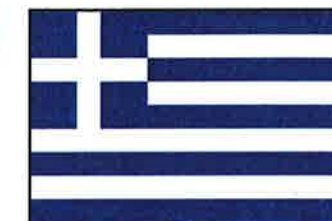
Etter Konstantinopels fall i 1453 ble Hellas dominert av det Osmaniske riket frem til 1829. I 1832 ble Hellas anerkjent som selvstendig stat.