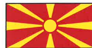
Dagens Makedonia ble innlemmet i det Osmaniske riket på 1300- og 1400-tallet. Makedonia ble selvstendig 8. september 1991 etter å ha vært en del av Jugoslavia siden 1918.