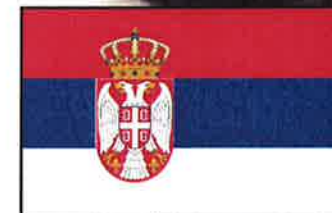
Serbia ble en del av det Osmaniske riket på begynnelsen av 1500-tallet. I 1804 fikk Serbia autonomi.

Under Süleyman 2 (1520-1566) nådde det osmanske riket sitt høydepunkt. På tre kontinenter hadde sultanen herredømme over veldige områder i det østlige Middelhavet, deler av Nord-Afrika, store deler av sørøst-Europa og Kaukasus. I det 16. og 17. århundre var verdens mest rike og mektige enheter som riket en av innflytelsespolitiske konstant truet europeiske stormakter med sine stadige fremstøt på Balkan og i de sørlige deler av Polen og Litauen. Riket ble også sentrum i den islamske verden etter erobringen av Konstantinopel, og særlig etter at sultanen overtok verdigheten som kalif i 1517.